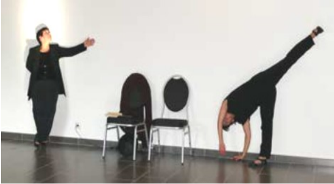
Une comédienne et une danseuse au service d'extraits littéraires et musicaux, tirés du courant minimaliste.

Musiques de Satie, Moondog, Glass, Pärt, Mertens