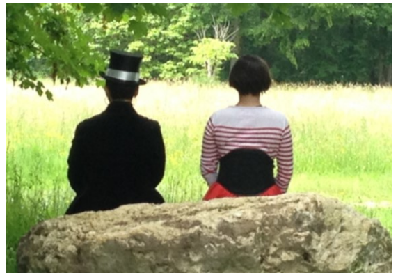
Invitation à « partir en voilage » ...

- Tout public à partir de 12 ans / Intergénérationnel -