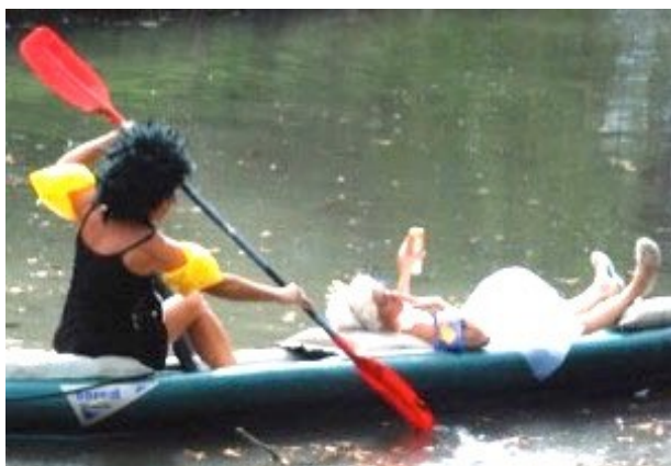
"Montons aux barricades du plein plaisir"

« J'en appelle aux vivants, aux bons vivants, gloire au désordre contre les mauvais vivants, hardi sabre au clair, montons aux barricades du plein plaisir de la vie pleine et entière, de la vie jouissante, buvons bras levé et le cœur haut. »